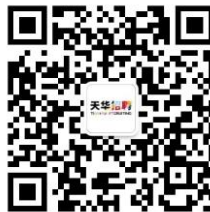
天华招聘微信公众号